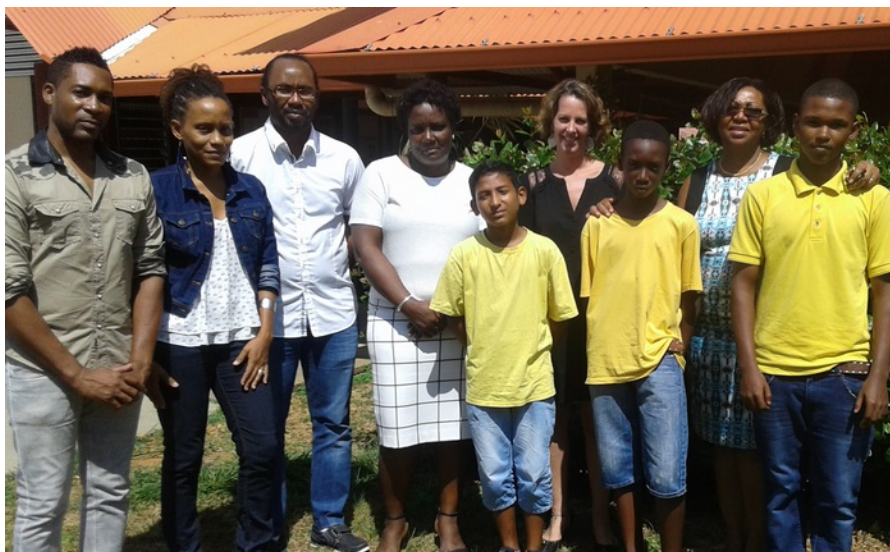
L'équipe prend la pose.