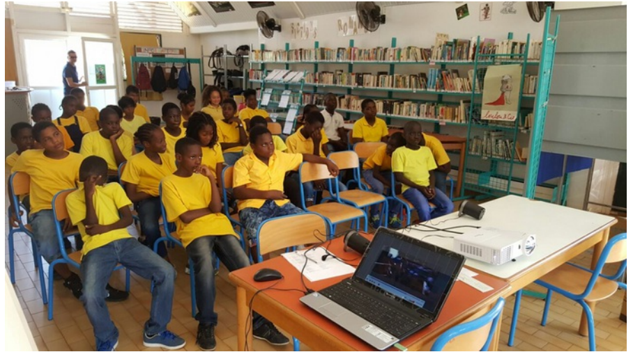
Les élèves du Club cinéma au collège Paul KAPEL.