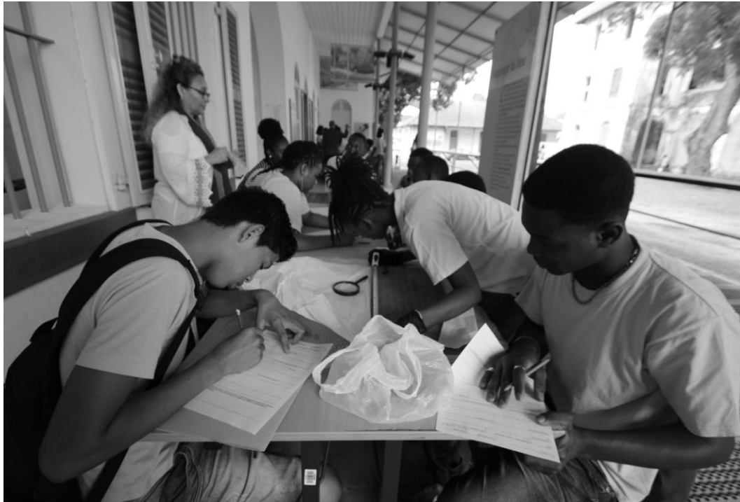
Compléter une fiche d'identification pour des objets.