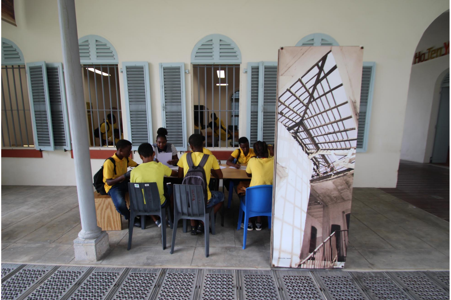
Mme Crémieux et les animateurs du Musée ont proposé deux ateliers qui correspondent aux deux parties du Pavillon.