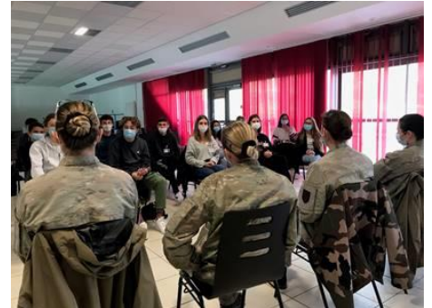
Des militaires féminins du 1 er régiment de parachutistes d'infanterie de marine de Bayonne ont rencontré la CDSG du lycée Sud des Landes à Saint-Vincent de Tyrosse.