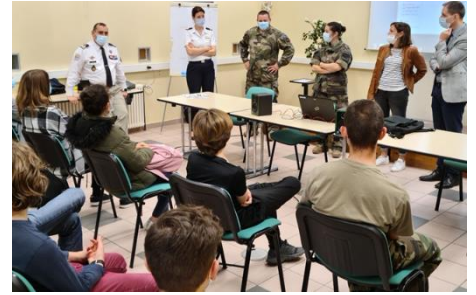
Le personnel féminin de la délégation militaire, du centre d'information et de recrutement des forces armées et du centre du service national et de la jeunesse des Pyrénées-Orientales ont rencontré les élèves du collège Mme de Sévigné à Perpignan.