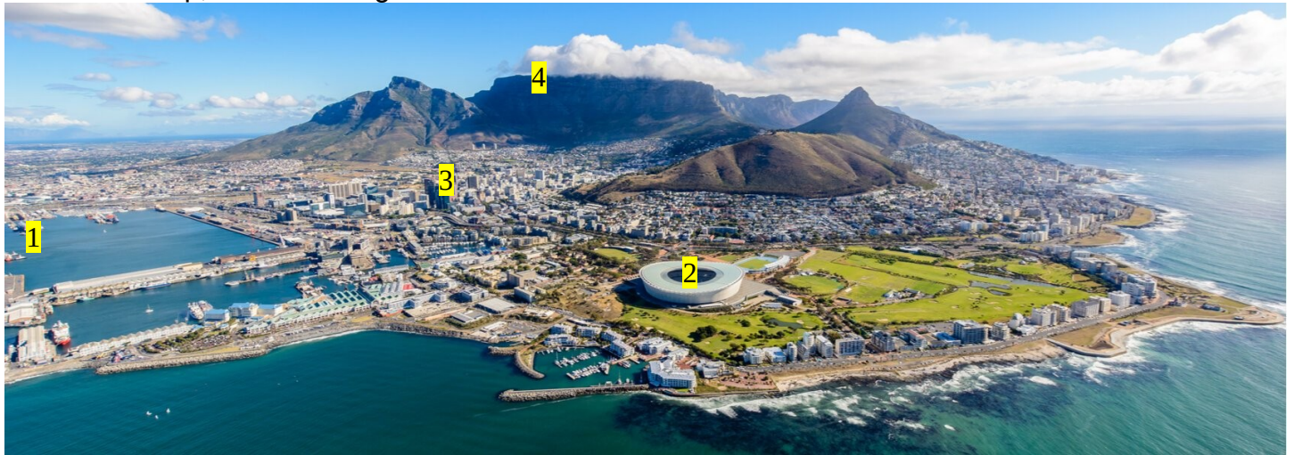
1. Port de commerce du Cap 2. Stade construit pour la coupe du monde de football de 2010 3. Quartier des affaires (CBD) 4. Table mountain (site touristique).